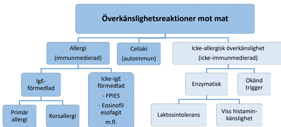
Figur 2. Indelning av olika sorters överkänslighetsreaktioner mot mat 3,9,10 .

IgE-förmedlad allergi är en komplex och multifaktoriell sjukdom. Ett samspel mellan olika genetiska faktorer och olika omgivningsfaktorer påverkar utvecklingen av sjukdomen men exakt hur de samspelar och påverkar vet man ännu inte 11 . Barn med allergiska föräldrar eller syskon har högre risk för att utveckla sjukdomen. Förutom genetiska faktorer, har många olika omgivningsfaktorer föreslagits som orsaker till utveckling av allergi.