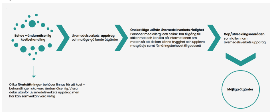
Figur 1. Processmodell över Livsmedelsverkets arbete

Under arbetes gång genomfördes avstämningar med nedanstående intressenter: