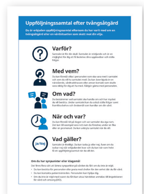
Använd informationsbladet som finns på sid 14.

Om erbjudandet avböjs, försök att ta reda på varför. Är det för nära i tid? Beror det på vem som frågar? Förklara att erbjudandet står kvar och fråga om det går bra att fråga igen vid ett senare tillfälle.