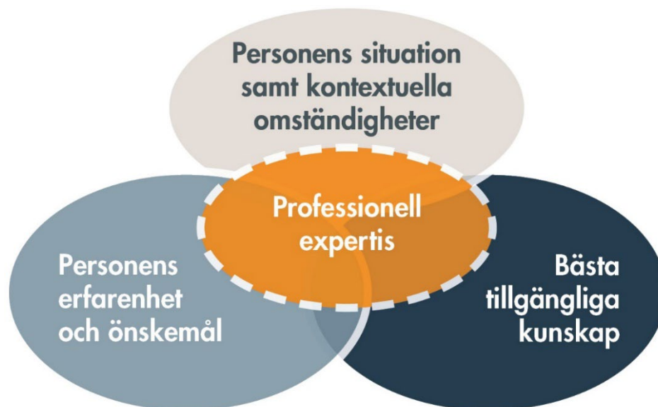
Figur 1. Den evidensbaserade modellen