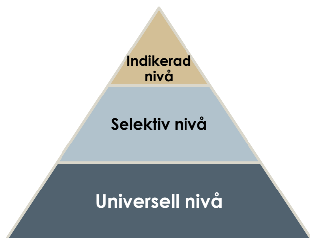
Figur 1. Preventionspyramiden

Schematisk bild av de olika preventionsnivåerna i socialt förebyggande arbete.