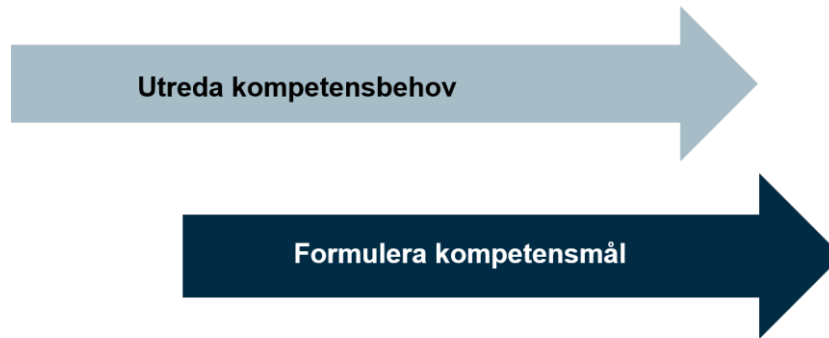
Figur 1. Arbetsprocess när Socialstyrelsens tar fram institutionella mål.

I det första delmomentet utreder vi hälso- och sjukvårdens eller socialtjänstens behov av kompetens i fråga om den aktuella yrkesgruppen. Här samlar vi in och analyserar data (kunskaper, erfarenheter och perspektiv). I datainsamlingen ingår ofta workshoppar eller dylikt med aktuella aktörer.