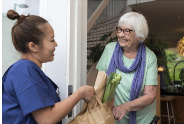
Undersköterska överlämnar en matkasse till en äldre kvinna.