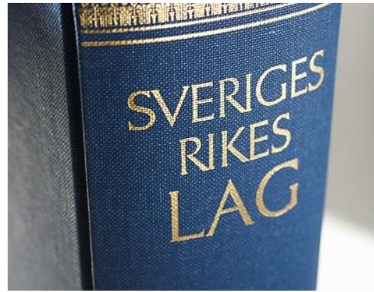
Boken Svea rikets lag.

De grundläggande kraven finns i lagar och förordningar som har beslutats av riksdagen och regeringen.