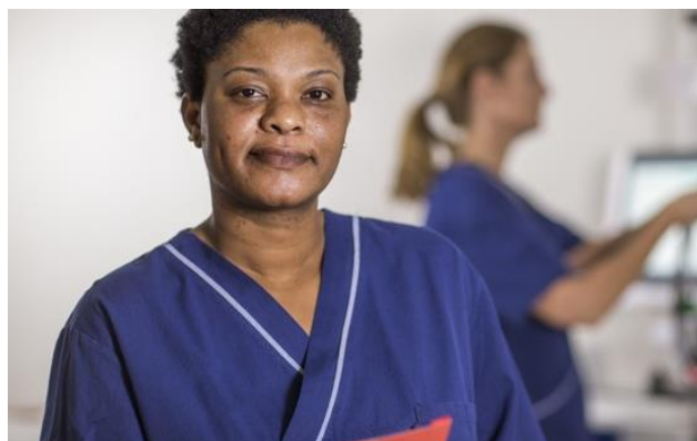
Undersköterska som ler och tittar in i kameran.