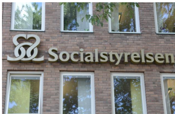
Fasaden på huset där Socialstyrelsen har sitt kontor.

Socialstyrelsen ska också ta fram regler som gör det tydligare vad som krävs för att få ett bevis om skyddad yrkestitel.