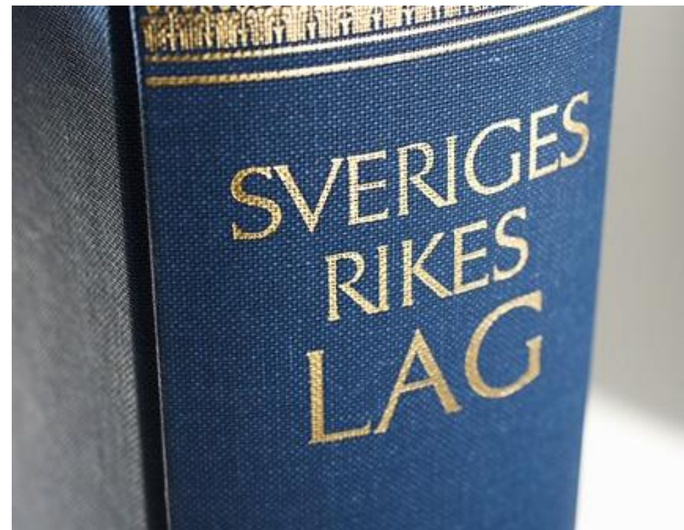
Boken Svea rikets lag.