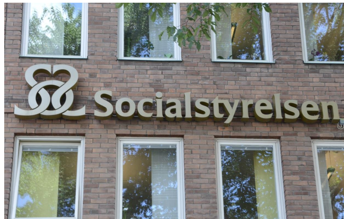
Fasaden på huset där Socialstyrelsen har sitt kontor.