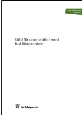
Vägledning Dokument med informationsstöd