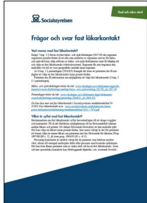
Frågor och svar Svar på återkommande frågor kring fast läkarkontakt

Materialet hittar du på Socialstyrelsen.se samt på kunskapsguiden.se