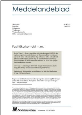
Meddelandeblad Information om juridiska förutsättningar