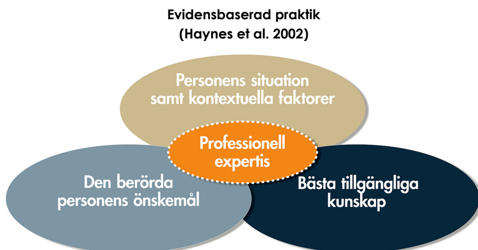
Figur 1. Den evidensbaserade beslutsprocessen [8]

I en evidensbaserad praktik har den professionelle en central roll. Arbetet brukar beskrivas i form av fem steg. Det första steget innebär att den professionelle identifierar personens problematik (t.ex. genom att använda bedömningsmetoder) och formulerar behovet av information till en fråga som går att besvara. I det andra steget söks efter bästa tillgängliga kunskap för att besvara frågan. I det tredje steget värderas den kunskap som finns med tanke på dess vetenskapliga tillförlitlighet och användbarhet. I steg fyra integrerar den professionelle denna kunskap med den berörda personens unika förutsättningar och önskemål samt balanserar och integrerar all information i beslutsfattandet. I det femte steget sker uppföljning av personen och fyra föregående stegen utvärderas i syfte att förbättra arbetet. Möjligheterna att genomföra en evidensbaserad praktik inom svensk socialtjänst beror således