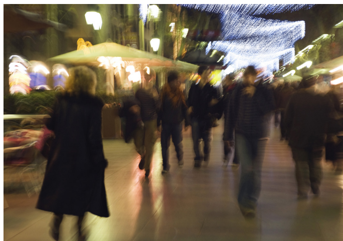
Personerna på bilderna har ingen koppling till innehållet.