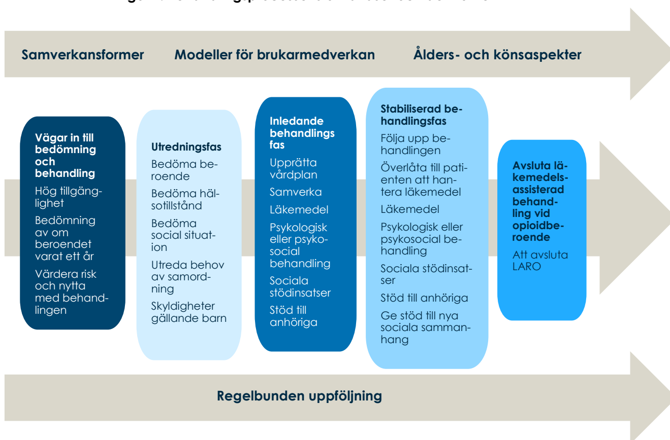
Figur 1. Behandlingsprocessens olika faser och delmoment

Socialstyrelsen genomförde 2015 en förstudie [3] för att undersöka behovet av ett kunskapsstöd för läkemedelsassisterad behandling vid opioidberoende. Förstudien resulterade i en modell för behandlingsprocessen och hur den kan delas in i olika faser (se figur 1). Samverkan, brukarinflytande och köns- och åldersaspekter lagts till som övergripande perspektiv som behöver beaktas i de olika faserna. En annan aspekt är regelbunden uppföljning under behandlingsprocessen. Modellen kan liknas vid en vårdprocess, med en början och ett slut, men när det gäller patientgruppen för läkemedelsassisterad behandling vid opioidberoende är det vanligare att patienterna kvarstår i någon fas, pendlar fram och tillbaka mellan olika faser eller att behandlingen avslutas.